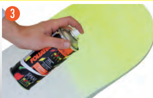
3 カラーコートを薄く何回かに分けて塗る