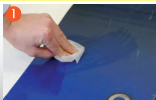
1 塗装面の汚れや油分を取り除く