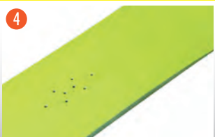
4 塗装完了後、30分以上経過すれば表面 は乾燥します