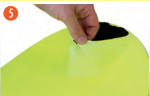
5 フィルムをはがす際は、端を爪などで引っ かけてきかけを作るとはがし易いです