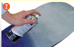
2 ベースコートを薄く何回かに分けて塗る 15分以上間隔を空ける